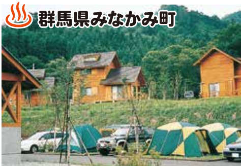
群馬県みなかみ町

住所: みなかみ町相保159-1 TEL: 0278-66-0402 FAX: 0278-66-0137